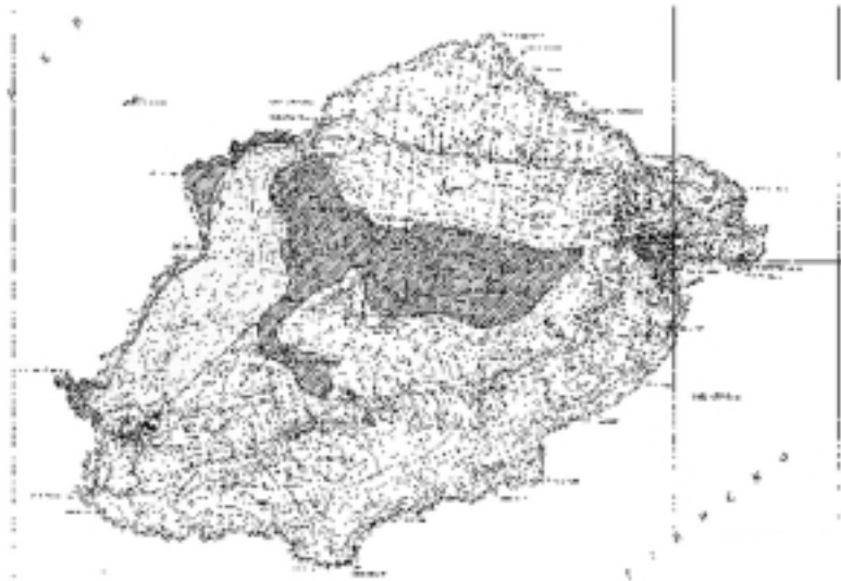
Fig. 1 — Perimetrazione della R.N.O. Isola di Ustica.

La Riserva è stata istituita per tutelare gli interessanti aspetti botanici, quali la presenza di Limonium bocconeii , le numerose entità caratteristiche della classe vegetale Crithmo-Limonietea ed i notevoli aspetti di macchia a Pistacia lentiscus ed Euphorbia dendroides . Altre valenze caratterizzano la Riserva, quali le numerose emergenze geologiche e la notevole rilevanza fau-