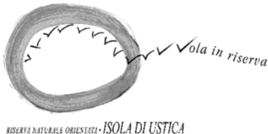
Fig. 3 — Logo della riserva, realizzato dagli studenti dell'Accademia di Belle Arti.

Inoltre, nell'ottica di valorizzare le attività agricole ecocompatibili, ed in particolare la produzione e commercializzazione della tradizionale lenticchia di Ustica, l'Ente Gestore ha promosso incontri con il “Comitato produttori di lenticchia Usticese” ed ha ottenuto da parte del Ministero delle Politiche Agricole, a seguito di specifica richiesta, l'inserimento della “Lenticchia di Ustica” fra i “Prodotti Agroalimentari Tipici” (Decreto dell'8/5/2001). È questa una ricompensa della singolare relazione esistente nell'isola tra l'uomo e la natura, tra il contadino e la terra, e che merita una seria considerazione. Dietro un pacchetto di lenticchie di Ustica, un pacco