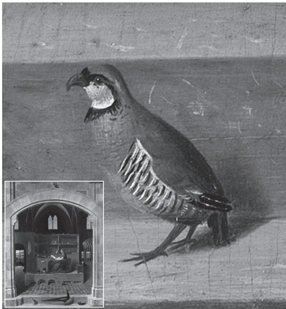
Fig. 1 - Particolare della “pernice” raffigurata nel “San Gerolamo nello studio” (riprodotto in basso a sinistra), conservato nella National Gallery di Londra.

specie, essa presenta una certa variabilità geografica, che ha consentito nel corso di un secolo di suddividerla in popolazioni geografiche morfologicamente riconoscibili a cui sono stati dati nomi sottospecifici, e precisamente: Alectoris graeca graeca (Meisner, 1804) (Grecia, Isole Ionie, Macedonia, Bulgaria, Albania), Alectoris graeca saxatilis (Bechstein, 1805) (Alpi italiane, francesi, austriache e slovene, Croazia, Bosnia, Serbia e forse Montenegro), Alectoris graeca orlandoi Priolo, 1984 (Appennino centrale e meridionale) e Alectoris graeca whitakeri Schiebel, 1934 (Sicilia, un tempo anche Pantelleria ed Eolie, ove è estinta). La forma più affine